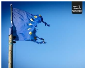
INTERNATIONELLA HÄNDELSE EUROPEISKA UNIONEN

Speltid: 3 min. Målgrupp: från 13 år. Utförande: Strömmande.