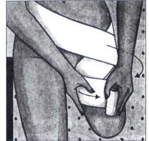
Linda i diagonala varv.