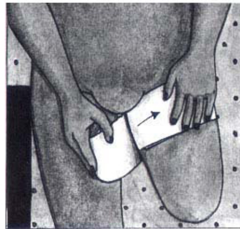
Linda 2-3 varv runt låret.

Vid frågor vänd er till: Ortopedteknisk avdelning: 010-8315362 eller fysioterapimottagningen vid Centralsjukhuset i Karlstad: 010-8315228.